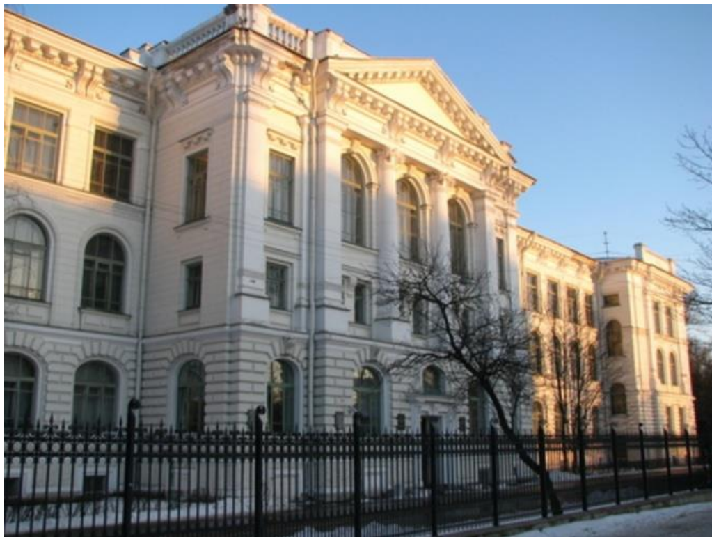
Санкт-Петербургский государственный технический университет им. Петра Великого