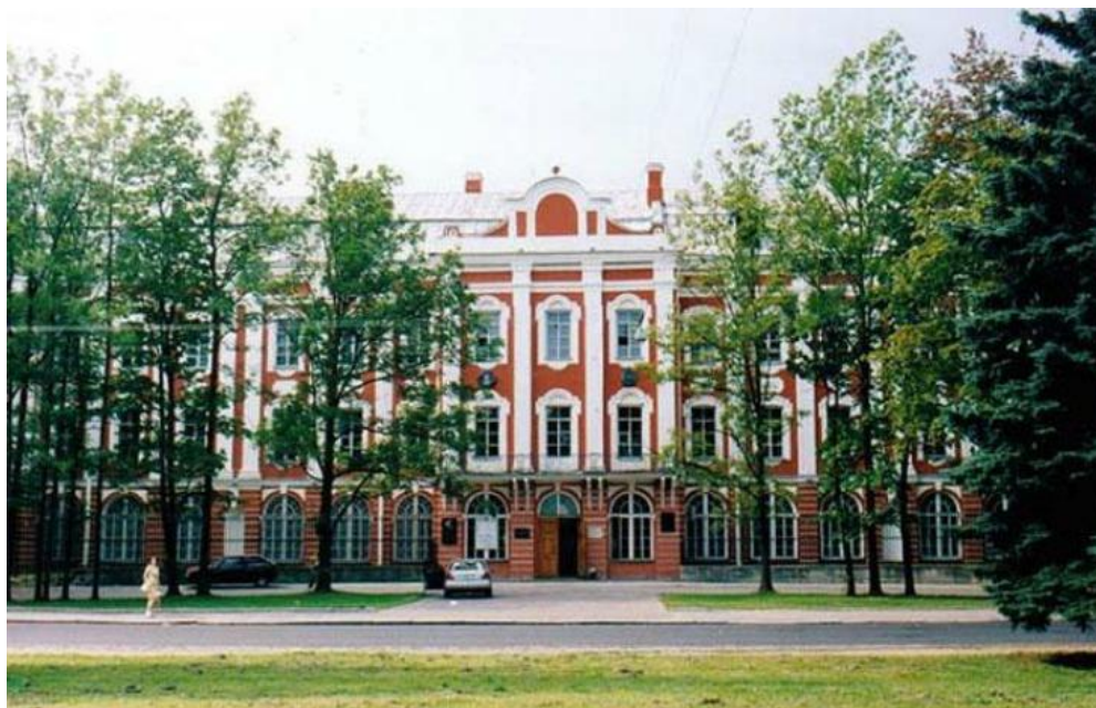
Санкт-Петербургский государственный университет

защитил в 1983 году кандидатскую диссертацию на тему «Групповой подход к исследованию некоторых классов обыкновенных дифференциальных уравнений» по специальности 01.01.02 – дифференциальные уравнения. Возникновение нового научного направления было окончательно оформлено защитой в 1992 году докторской диссертации на тему «Дискретно-групповой анализ обыкновенных дифференциальных уравнений» по той же специальности.