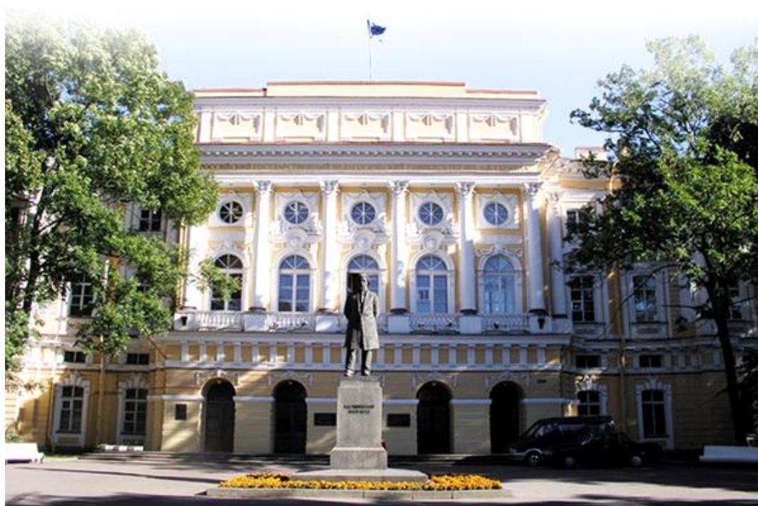
Российский государственный педагогический университет им. А.И. Герцена